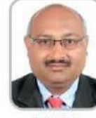
S. L. Bhut AGM