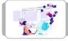
Debit Card E-Commerce ઓનલાઈન શોપિંગ