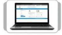
Net Banking પર્સનલ કોમ્પ્યુટર દ્વારા ફંડ ટ્રાન્સફર