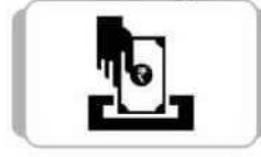
ICD Service અન્ય બેંકના ખાતામાં મશીન દ્વારા કેશ જમા કરવાની સુવિધા