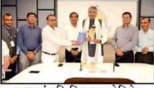
રાજ્યનાં કૃષિ વિભાગના કેબિનેટ મંત્રીશ્રી રાઘવજીભાઈ પટેલ