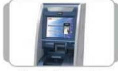
Cash Recycler રોકડ જમા / રોકડ ઉપાડ