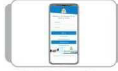
Mobile Banking મોબાઈલ દ્વારા ફંડ ટ્રાન્સફર