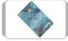
Rupay Platinum Contactless Debit Card વધુ સુવિધા સાથે