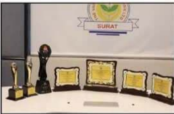
વર્ષ 2023-24 માટે બેંકને મળેલ સિદ્ધી-સન્માન એવોર્ડ્સ