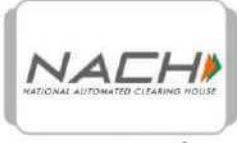
NACH આધાર નંબર વડે મળતા સરકારી લાભો સીધા ખાતામાં