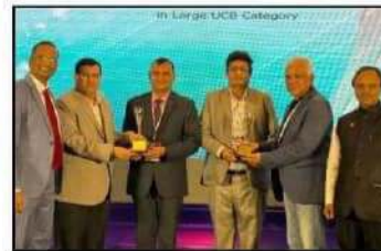
બેન્કીંગ કન્ટ્રીયર દ્વારા વર્ષ 2022-23 માટે બેંકને મળેલ “બેસ્ટ કો-ઓપ.બેંક” તેમજ “બેસ્ટ ક્રેડિટ ગ્રોથ” એવોર્ડ સ્વીકારતા બેંકના જનરલ મેનેજરશ્રી સાથે IT AGM