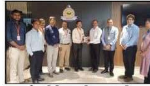
દેવગીરી નાગરીક સહકારી બેંક, મહારાષ્ટ્રના અધિકારીશ્રીઓ