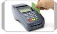
Debit Card ઓફલાઈન શોપિંગ