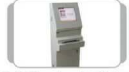
Self Passbook Printer પાસબુક પ્રિન્ટર