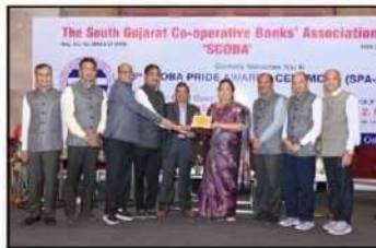
સ્કોબા પ્રાઈડ એવોર્ડ્સ-23 માં એવોર્ડ સ્વીકારતા બેંકના હોદ્દેદારશ્રીઓ