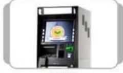
ATM રોકડ ઉપાડ / ફંડ ટ્રાન્સફર