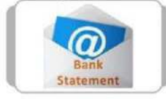
E-Statement દર મહિને ઈ-મેઈલ પર ખાતાનું સ્ટેટમેન્ટ મેળવવા માટે