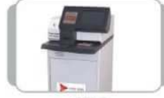
CDK ક્લિયરિંગ ચેક જમા